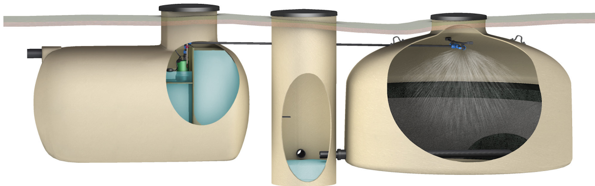
HACO GV-B1 med slamavskiller